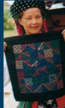
Sopra: una produttrice mostra un tessuto con disegni tradizionali