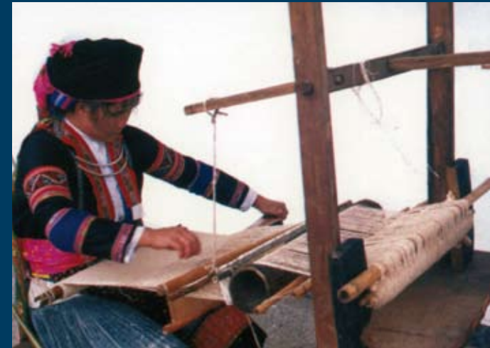
Sotto: una donna Hmong lavora al telaio manuale per la creazione di tessuti tipici vietnamiti