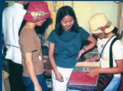
In alto e sotto: artigiane Hmong discutono nuovi prodotti

Produttrici e stiliste di CL collaborano strettamente per la creazione di nuovi modelli. Il processo creativo inizia con un'approfondita ricerca nell'ambito delle tradizioni locali. Nei "laboratori creativi" gli artigiani sviluppano poi una serie di nuovi prodotti, utilizzando motivi e tecniche tradizionali e facendo prove con vari colori e materiali.