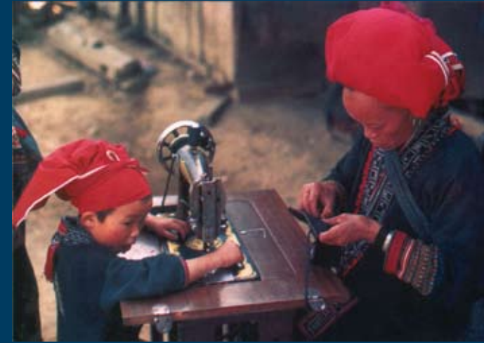
In alto: un'artigiana al lavoro nel proprio ambiente domestico

I coordinatori di progetto e gli stilisti di CL offrono formazione per: design, cucitura a macchina, filatura e tessitura, gestione, contabilità e marketing.