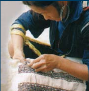
In alto: donne Thai della provincia di Nghe An tramandano tecniche tradizionali di filatura, tintura e tessitura della seta